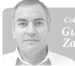
Columna de Gustavo Zamora