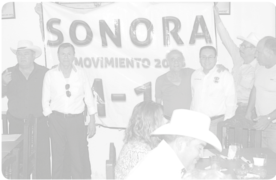
El movimiento se conforma por hombres y mujeres, que buscan un triunfo electoral para Andrés Manuel López Obrador en las elecciones presidenciales de 2018.